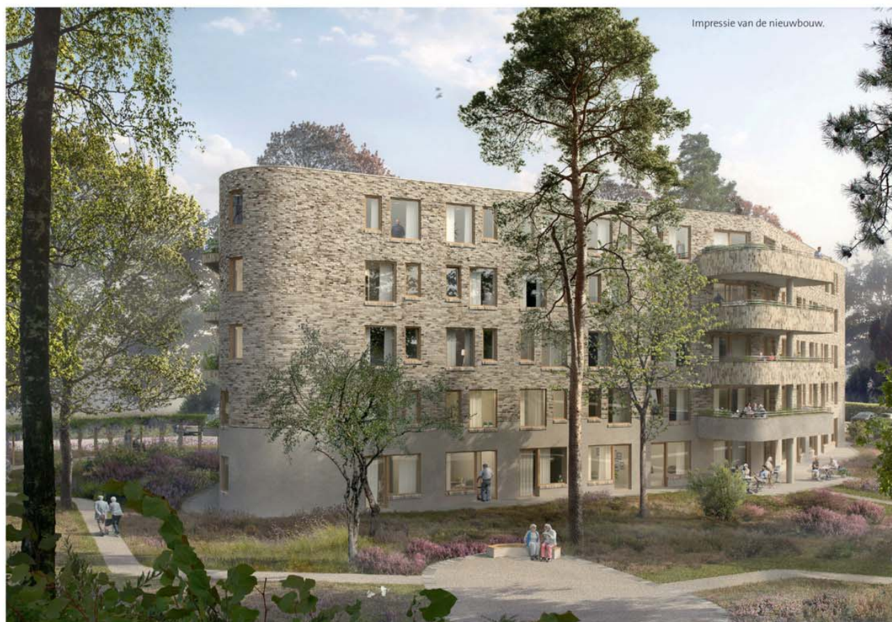
Impressie van de nieuwbouw.

De Utrechtse organisatie voor ouderenzorg Warande realiseert in Zeist nieuwbouw geïnspireerd op hun visie op leven, wonen en werken, die aansluit bij het antroposofische gedachtegoed. De kleine, vleugelvormige afdelingen geven bewoners als ze hun kamer uitkomen direct zicht op een centrale plek met huiskamerkwaliteit. Daar is ruimte voor gezelligheid en vers koken, reuring en mijmering. Familieleden en vrijwilligers kunnen er meeleven en meewerken.